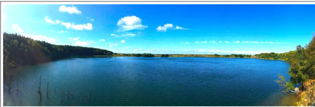
Udsigten over Pyritsøen mod Østersøen. Der er en god gang/mountainbikesti hele vejen rundt om søen !