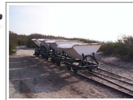
De gamle kulvogne kan stadig opleves ved "Kultippen" ved Hasle.

Rubinsøen 3 km fugleflugt fra Hotel Skovly