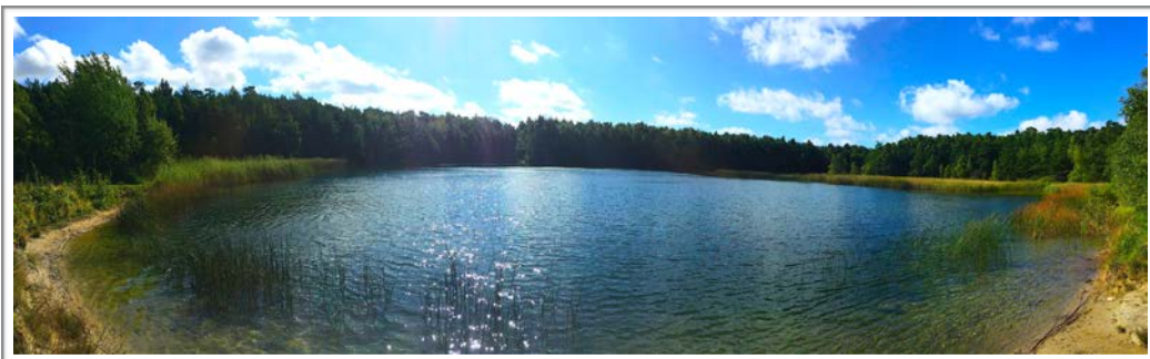
Udsigten over Safirsøen mod Hotel Skovly. Hele søen er omkranset af en sti, som både kan benyttes af gående og med mountainbiken !